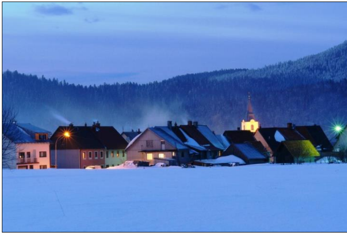
Delnice, hrvatski grad na najvišoj nadmorskoj visini

Područje Grada Delnica gledano geografski čini "Delnički trolist" - Delnice, Crnoluško - risnjački kraj i Kupaska dolina. Delnice su središnje i najveće naselje Gorskog kotara te ujedno i grad na najvećoj nadmorskoj visini u Hrvatskoj, smještene na nadmorskoj visini od 698 metara i uokvirene uzvišenjima